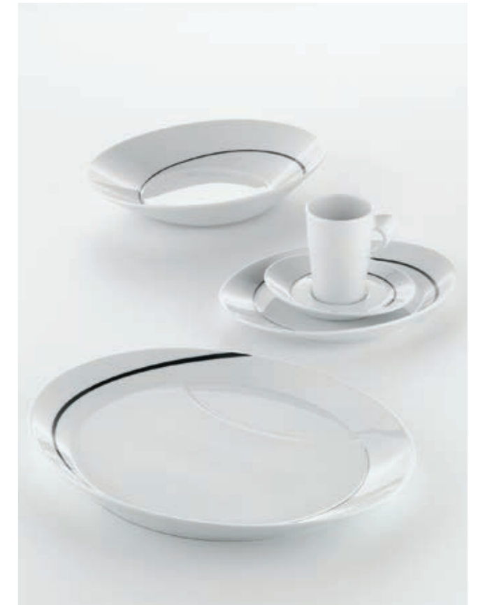
DEKOR IDENTITY 62866