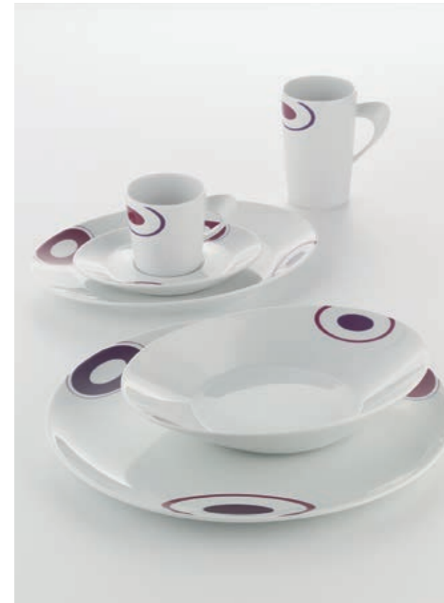
DEKOR TOMORROW 62865

SIGNATURE besticht durch zeitlos edle und doch moderne Optik. Die verschiedenen Dekorkonzepte setzen spielerische und charmante Akzente, die sich in den Formen und Farben an der Klarheit des Designs orientieren. Asymmetrische Flächen und Linien vermitteln den Porzellantteilen eine individuelle Note, die einen emotionalen Spannungsbogen zur kreativen Inszenierung Ihrer Speisen schafft. Die SIGNATURE Dekore überraschen durch kraftvolle Farben und Formen und setzen faszinierende Akzente.