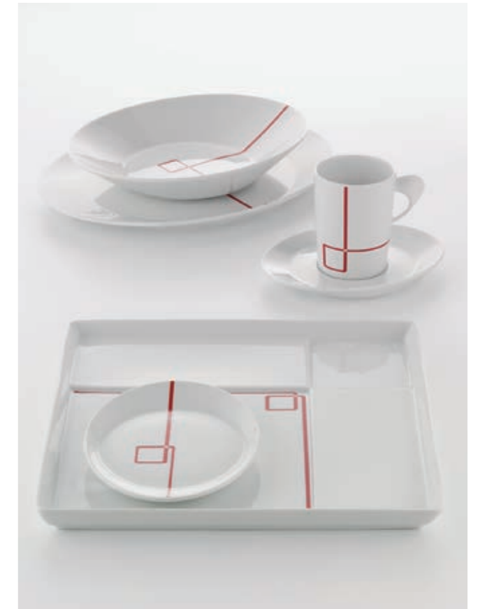
DEKOR GUIDE LINE 62864