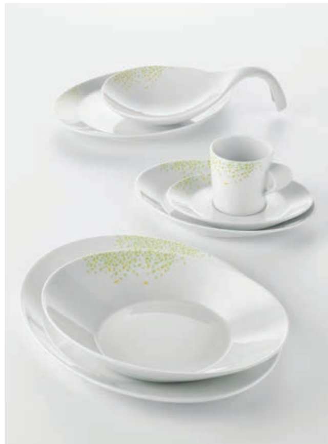
DEKOR JUST NATURE 63093