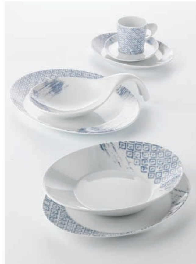
DEKOR STONEWASHED 63094