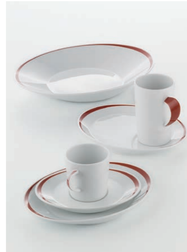
DEKOR EXPERIENCE 62867